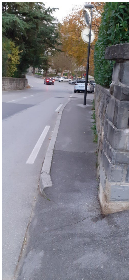
Slika 4: Pločnik v Dekanah

Pločniki v MOK niso vsi primerni za vse skupine ljudi (Priloga 3). Neprimerni pločnik se začne od potniškega terminala proti Luki Koper, saj sta oba pločnika na levi in desni strani preozka, poleg tega pa je na pločniku zarisana kolesarska steza, ki pa je tudi nevarna na določenih ovinkastih mestih, saj je tu mesto za pešce in kolesarje preozko in zaradi neprimerne širine pride lahko do nesreče.