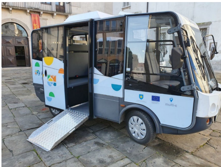
Slika 7: Kurjerca

Pisava voznih redov avtobusov v MOK je premajhna za slabovidne in napisi na avtobusih so za invalide na vozičku previsoki. Manjkajo zvočne najave v avtobusih, iskrice za opozorila, da so na avtobusih tudi invalidi.