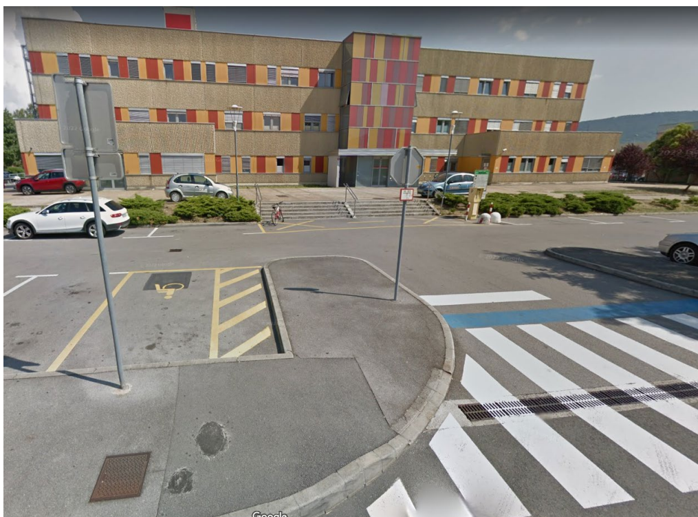
Slika 1: Parkirna mesta pred ZD Koper - Bonifika

Parkirna mesta za invalide ob balinarski dvorani so preveč oddaljena od ZD. Parkirno mesto pred ZD je samo eno, kar je premalo glede na frekventne obiske ZD. Ni klančine, samo stopnice. Če hoče invalid na vozičku priti do vhoda, mora na cesto, kjer ni pločnika in zatem skozi intervencijsko pot do vhoda, kar je popolnoma neprimerno za dostop do javnega zdravstvenega doma.