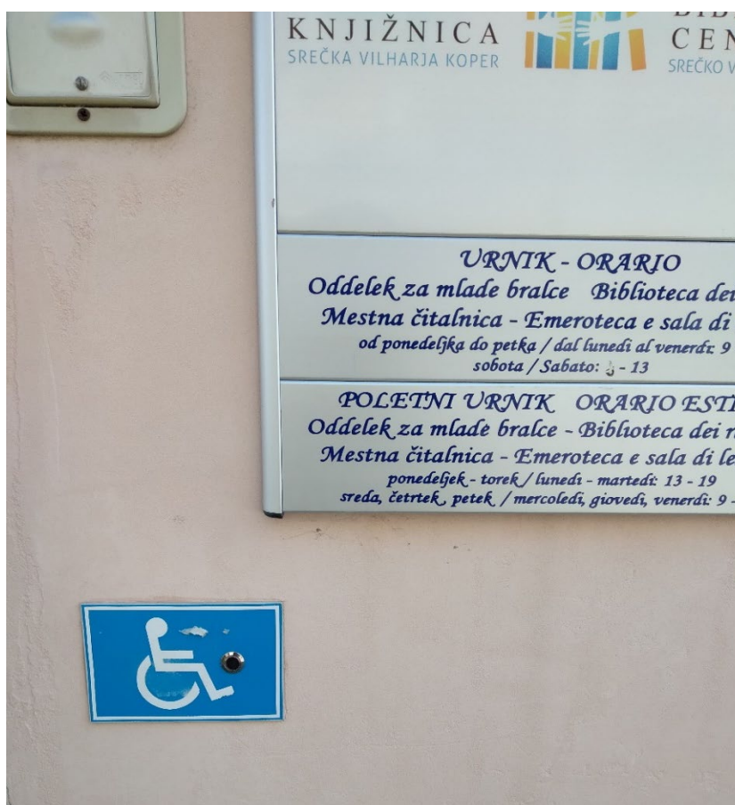
Slika 5: Domofon z nalepko pred Osrednjo knjižnico Srečka Vilharja, oddelek za mlade bralce na Verdijevega 2