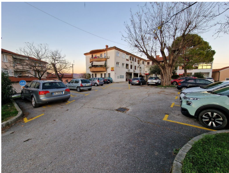
Slika 6: Parkirišče pri pošti brez parkirnih mest za invalide v KS Škofije